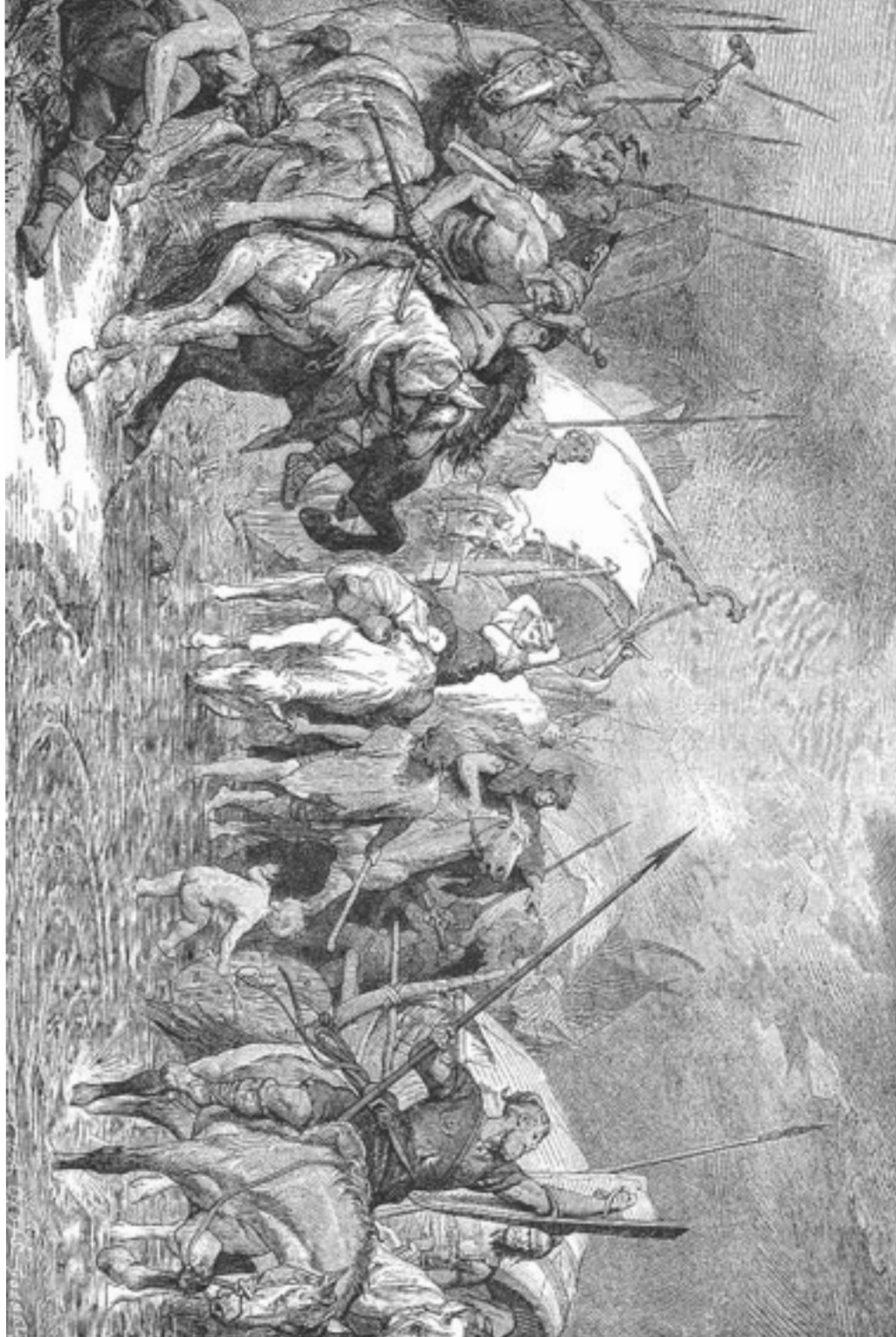
تصوير فني لفرسان الملك النوميدي بوعرطا وهو يحتاج أسبانيا

بشخصيتهم وتقاليدهم الحسنة. لا يستبد بهم لوجدان كالأطفال والنساء والأم الضعيفة فيجرون وراء البريق، بريق الجمرة ليقبضوا عليه، ويطلقون الجوهرة، وتستميلهم برقشة الأفعى فيجرون وراءه، زاهدين في أطواقهم الذهبية، وحللهم المزركشة.