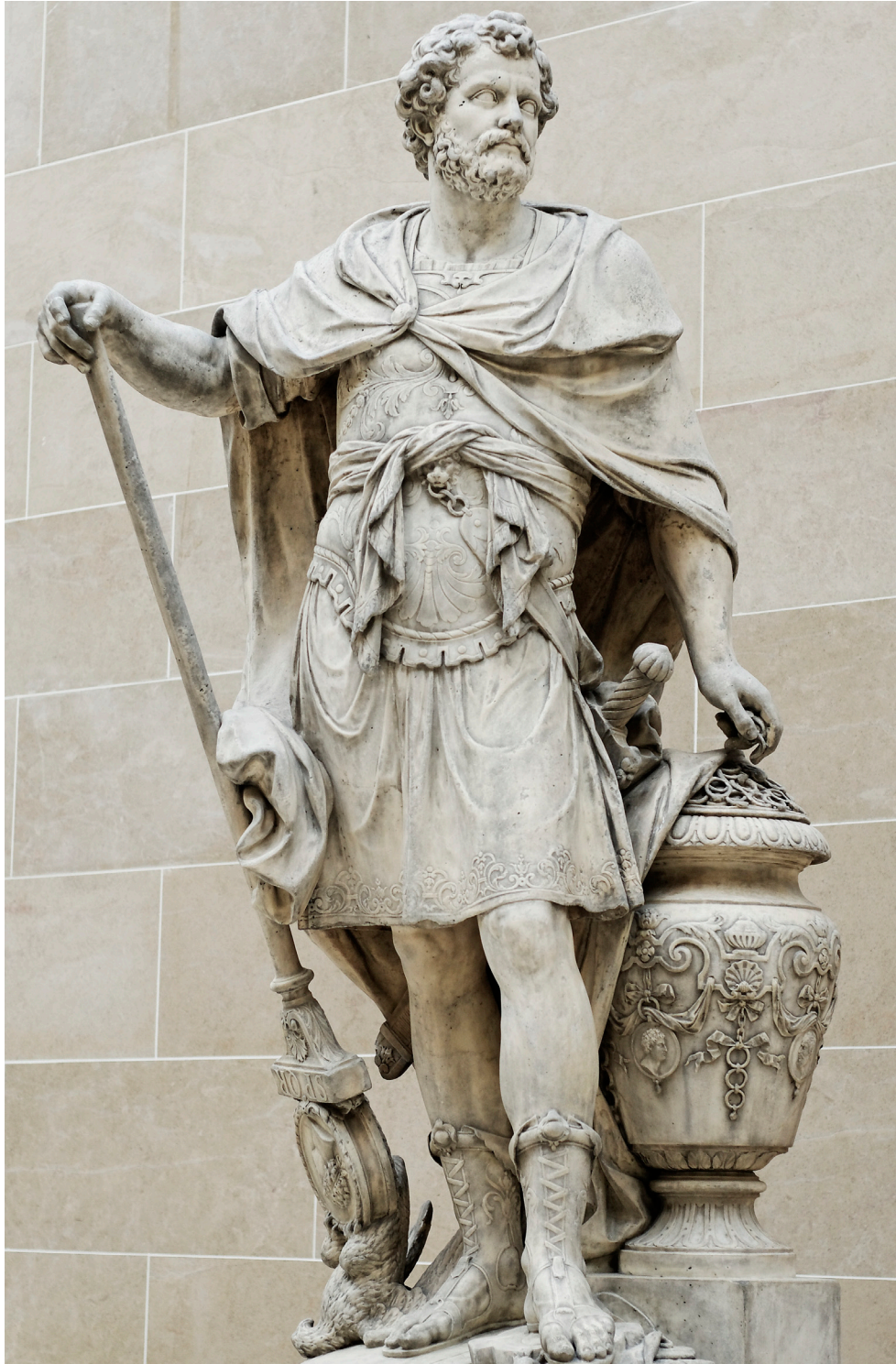
بطل المغرب الكبير حنبعل بن عمقرط

مأجور. قد قتلته الهزيمة. واخمد قواه الإنكسار. لو كان البربر أصدقاء لدولته لسقى بهم سبيون وجنده الموت الزؤام. وعفرهم بالهزيمة! لو كان مصينيسا حليفا له لاستطاع ان يكيل لسبيون على الصاع صاعين. ويريه فتكة الأسود الضارية بالنمورا! ولكن دولته بحمق الهرم. وغطرسة الغنى. وظلم الأناية جعلت البربر أعداءها. وصيرت مصينيسا عدوها اللدود. لا يتمنى إلا زوالها! ويل البونيقيين! وويل قرطاجنة! انها تريد ن ينازل سبيون المدجج بسيوف الهند الفتاكة. بالعصي الرخوة الواهنة. وناطق جبل الصوان في جيش البربر والرومان. بقوارير قرطاجنة التي أوهنتها الحارة! ولكن لا بد من الأقدام. ان الرومان في عقر داره. إذا لم يسر إليهم ساورا إليه. ان حنبعل العظيم لا يقاتل من وراء أسوار قرطاجنة كما يفعل الجبناء. بل يبرز إلى عدوه فيقاتله في العراء.